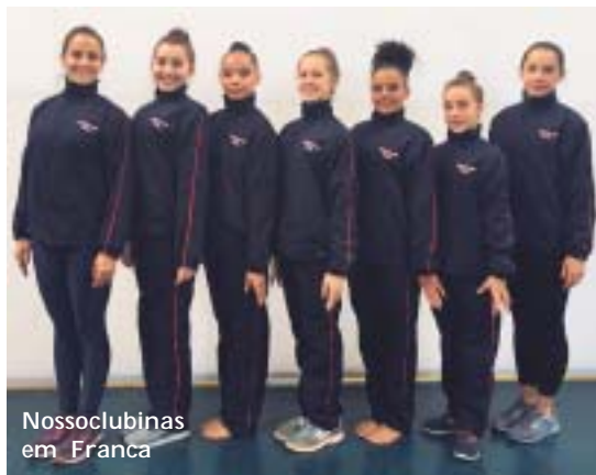
Nossoclubinas em Franca