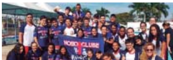
Atletas do Nosso Clube/Sesi em Mococa

COPA SP - Representada por 35 atletas, a equipe Nosso Clube/Sesi terminou na 3ª colocação geral, entre as 50 entidades participantes, da 12ª Copa São Paulo de Inverno para Nadadores Vinculados. A competição, que reuniu um total de 780 nadadores, aconteceu na Associação Esportiva Mocoquense, em Mococa, entre os dias 8 e 10 de junho. Os nossoclubinos conquistaram 28 medalhas, sendo 10 de ouro, 9 de prata e 9 de bronze.