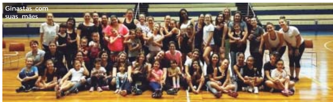
Ginastas com suas mães

No dia 19 de maio, as professoras de ginástica rítmica do Nosso Clube organizaram um evento que reuniu as mães e as ginastas da modalidade para comemorar o Dia das Mães. Nesse dia, as mães puderam vivenciar um pouco das aulas de suas filhas, além de se divertir bastante. No final do evento, foi oferecido um café da manhã para todas as participantes.