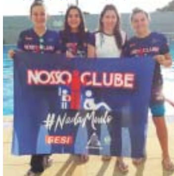
Nadadoras em Bauru

PAULISTA INFANTIL - Reunindo os melhores nadadores da categoria do Estado de São Paulo, a Arena ABDA de Bauru recebeu entre os dias 22 e 24 de junho o Campeonato Paulista Infantil de Inverno. A equipe Nosso Clube/Sesi esteve presente com quatro atletas, que tiveram ótimo desempenho. No total, o torneio recebeu 353 competidores de 45 entidades.