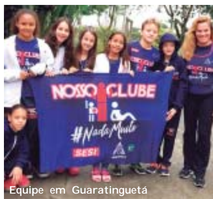
Equipe em Guaratinguetá

PAULISTA INFANTIL - Reunindo os melhores nadadores da categoria do Estado de São Paulo, a Arena ABDA de Bauru recebeu entre os dias 22 e 24 de junho o Campeonato Paulista Infantil de Inverno. A equipe Nosso Clube/Sesi esteve presente com quatro atletas, que tiveram ótimo desempenho. No total, o torneio recebeu 353 competidores de 45 entidades.