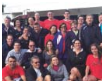
Limeira Máster/Alman conquistou 44 medalhas na 3ª etapa do Circuito Unami, disputada na Ferroviária de Botucatu

COPA SP - Representada por 35 atletas, a equipe Nosso Clube/Sesi terminou na 3ª colocação geral, entre as 50 entidades participantes, da 12ª Copa São Paulo de Inverno para Nadadores Vinculados. A competição, que reuniu um total de 780 nadadores, aconteceu na Associação Esportiva Mocoquense, em Mococa, entre os dias 8 e 10 de junho. Os nossoclubinos conquistaram 28 medalhas, sendo 10 de ouro, 9 de prata e 9 de bronze.